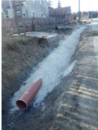
A csomópont és a járda építéséhez szükséges előkészítő, területrendezési munkálatok (2019.március hónap)